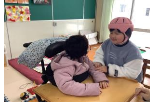
小学部 日常生活の指導 「朝の会」