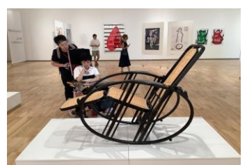
中学部 修学旅行 富山県美術館