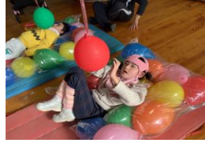
小学部 遊びの指導 「風船で遊ぼう」