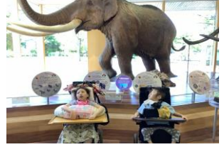
小学部 校外学習 富山市科学博物館